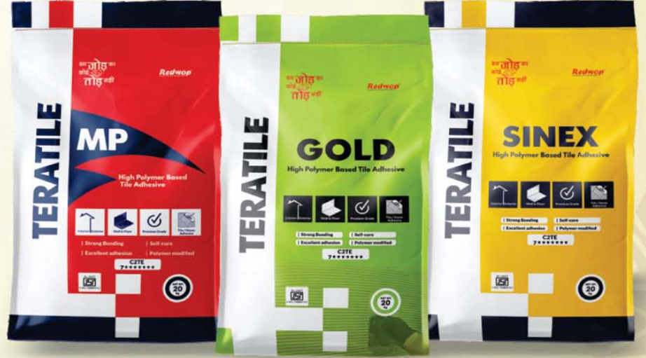
Tile Bonding Adhesive