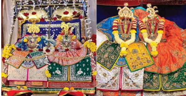
સેવાકીય સંપ્રદાયના કોરોનાકાળ પ્રવૃત્તિઓને બીરદાવી હતી.