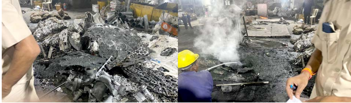
(વર્તમાન પ્રવાહ ન્યુઝ નેટવર્ક) ગામે આવેલ નીતિન કાસ્ટિંગ સેલવાસ, તા.૨૩ કંપનીમાં કોઈક દાદરા નગર હવેલીના સુરંગી કારણસર મશીનમાં ધમાકા સાથે બ્લાસ્ટ થયો હતો, જેના કારણે આગ પૂણ પકડી લીધી હતી આ ઘટનામાં એક મશીન અપોરેટરને ઈજા થઈ હતી. જેને તાત્કાલિક સારવાર માટે સબ જિલ્લા હોસ્પિટલ ખાનવેલમાં સારવાર

અર્થે દાખલ કરવામાં આવ્યો હતો. નીતિન કાસ્ટિંગ લિમિટેડ કંપનીમાં આગ લાગવાના કારણે સંચાલકો દ્વારા ફાયર વિભાગને ટેલીફોનિક જાણ કરાતા ફાયર ફાઈટરોની ટીમ તાત્કાલિક ઘટના સ્થળે ધસી આવી હતી અને આગને ઓલવવાની કામગીરી શરૂ કરી દીધી હતી. જેમાં એક કલાકની ભારે જહેમત બાદ આગ પર કાબુ મેળવ્યો હતો. આ ઘટનામાં એક વ્યક્તિને ઈજા થવા સિવાય અન્ય કોઈ જાનહાનીની ઘટના બનવા પામેલ નથી.